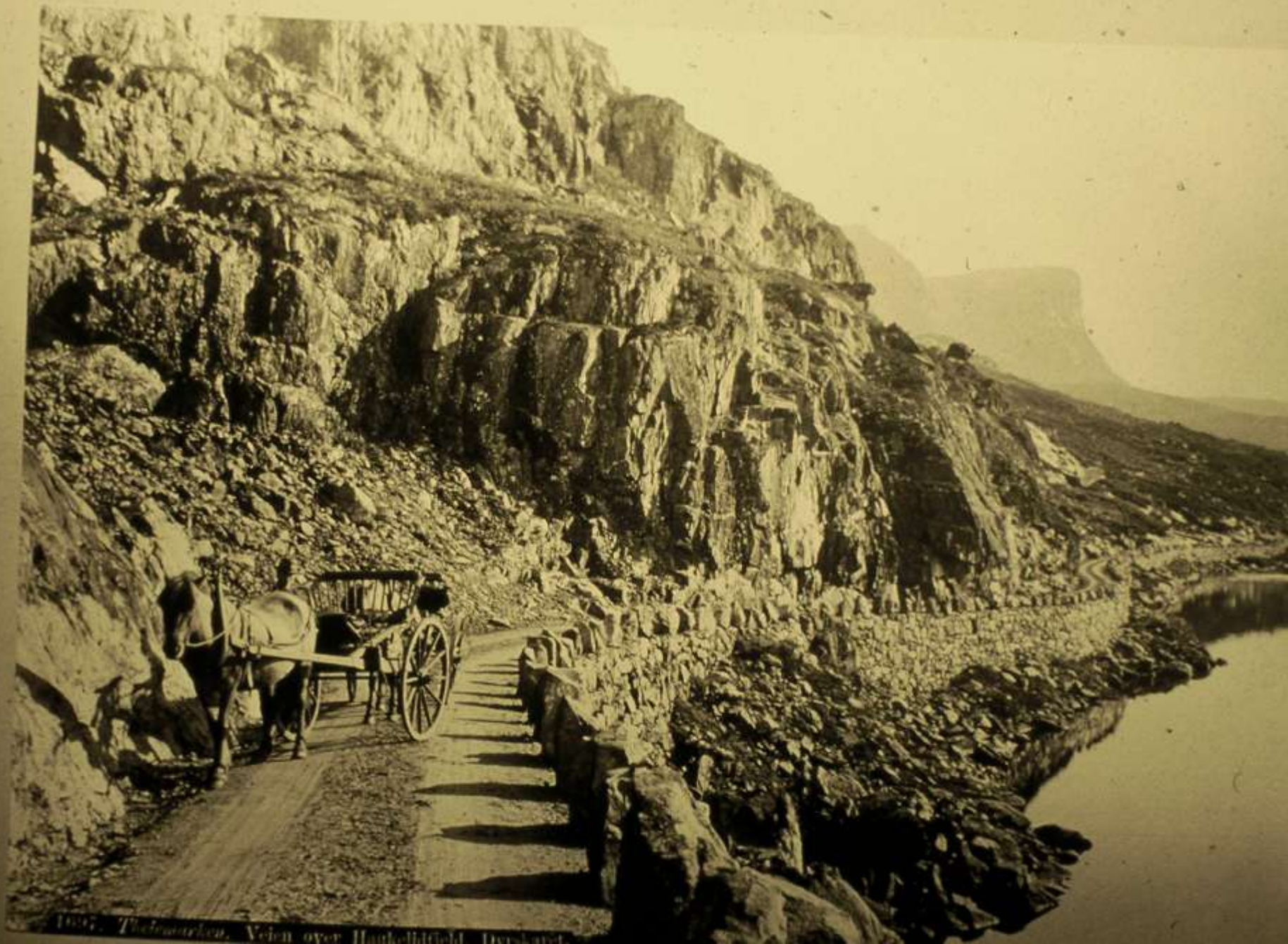
1907. Tschouwen. Vehn over Haghellbühl. Dersland.